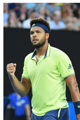
Jo Wilfried TSONGA